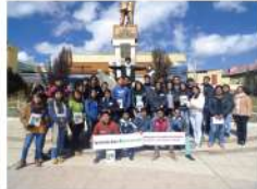
UNDAC - Cerro de Pasco