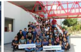
UDEP - Lima