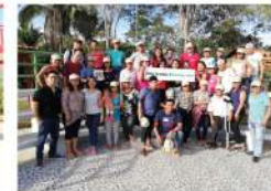
UNIA - Ucayali