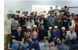
SENATI - Arequipa