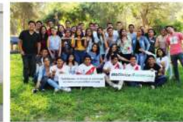
UNP II - Piura