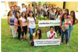
U. N. de Tumbes