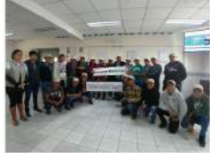
SENATI - Cusco