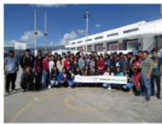
SENATI - Huancayo