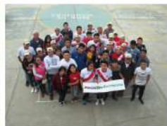
SENATI - Chimbote