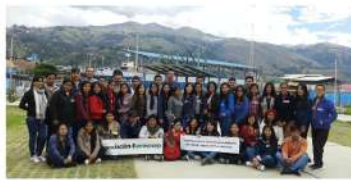
UNASAM - Huaraz