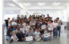
SENATI - Cajamarca