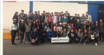
SENATI - Callao