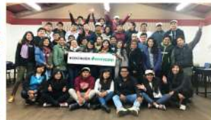
UNSAAC I - Cusco