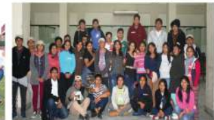
UNAMAD - Madre de Dios