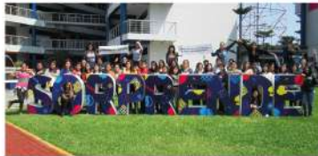
U. César Vallejo - Lima