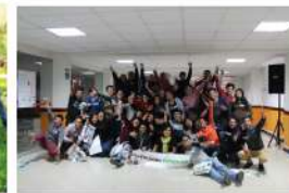
UPAGU - Cajamarca