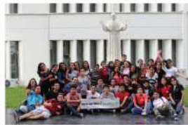
USAT - Chiclayo