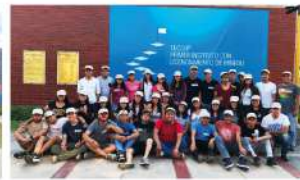
TECSUP - Lima