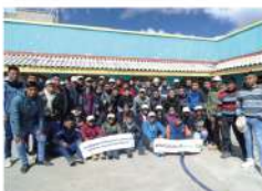
SENATI - Pasco