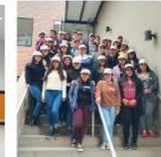
IPFE - Lima