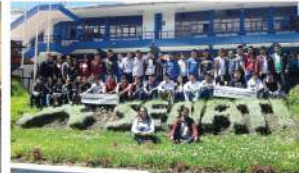
SENATI - Huaraz