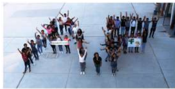
SENATI - Chiclayo