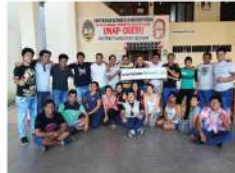
UNAP - Puno