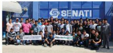
SENATI - Piura