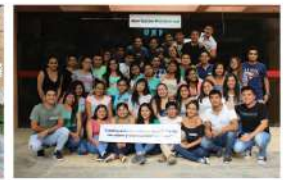
UNP I - Piura