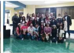
UNPRG I - Lambayeque