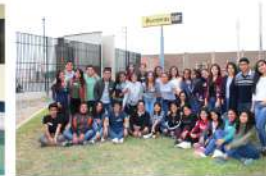
UPT - Tacna